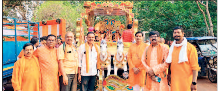
हरिभूमि न्यूज ►► गुरूर

नगर में शुक्रवार राम जन्मोत्सव के अवसर पर विशाल शोभायात्रा निकाली गई। जिसमें बड़ी संख्या में शहरवासी के साथ ग्रामीण अंचलो