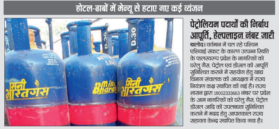
होटल-ढाबों में मेन्यू से हटाए गए कई व्यंजन

शहर के कई होटल व्यवसायियों ने बताया कि गैस संकट के कारण मेन्यू से कई व्यंजन हटाने पड़े हैं। समोसा, चाय, सब्जी और अन्य तले-भुने खाद्य पदार्थों की कीमतों में बढ़ोतरी करनी पड़ी है। ग्राहकों की संख्या भी प्रभावित हो रही है, जिससे रोजमर्रा की