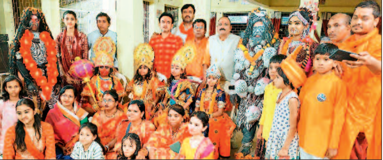
आकर्षण का केंद्र बनीं जीवंत झांकियां

नगर में शुक्रवार राम जन्मोत्सव के अवसर पर विशाल शोभायात्रा निकाली गई। जिसमें बड़ी संख्या में शहरवासी के साथ ग्रामीण अंचलो